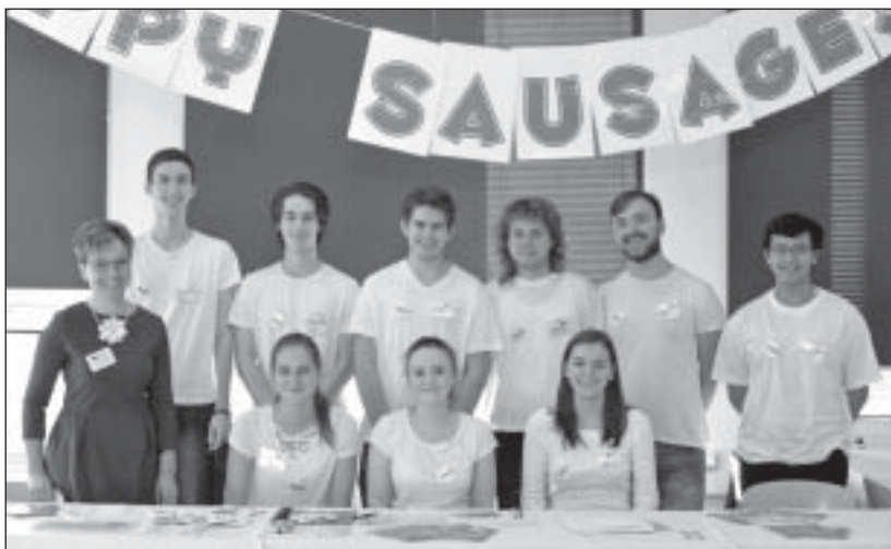
Happy Sausages, s. r. o. (studenti 3. ročníku SOŠ Gymnázium, SOŠ a VOŠ Ledec n. S.)

představ. V průběhu těchto dvou dnů náš stánek navštívila veřejnost a zájemci o studium informačních technologií i strojírenství, kteří nás hodnotili velmi kladně. I přes počáteční obavy se vše vydařilo na jedničku a jsme moc rádi za možnost vyzkoušet si komunikaci s veřejností a vyřizování objednávek jako ve skutečné firmě.